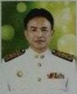
นายกเทศมนตรี นอนตORN นอนตORN นายกเทศมนตรีพิเศษเขตเทศบาล