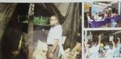
ภาพการจัดกิจกรรมวันเด็กแห่งชาติ ประจำปี 2558 เมื่อวันที่ 9 มกราคม 2558